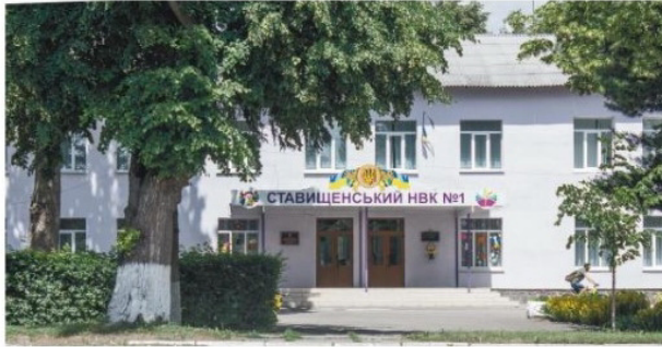
З новим фасадом учням тепло і затишно