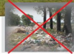
Замість стихійних звалищ буде сучасний полігон відходів