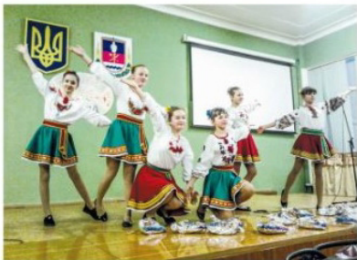
«Ранкова зірка» вже 17 років допомагає розкритися юним талантам