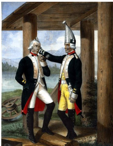
Гренадёры Азовского и Орловского полков.