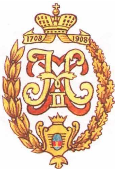
Ладожский 16 пехотный полк

С 04.05.1808 по 27.02.1811 года, полком командовал майор (подполковник, с 21.09.1810 полковник) Савоини Еремей Яковлевич (1776-1836), итальянец по происхождению. Принимал участие в Отечественной войне 1812 года 2 .