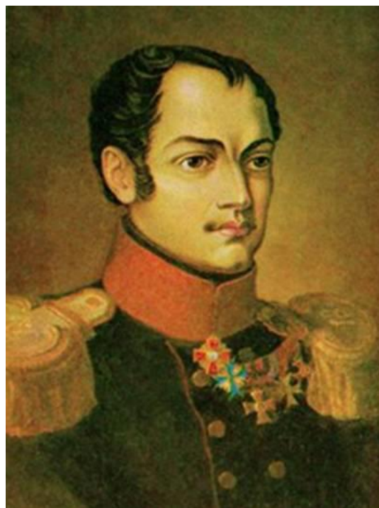
Пестель Павел Иванович

В 1825 году в Ставище дислоцировался Азовский 45-й пехотный полк, который был приведён к присяге генерал-майором, князем Сергеем Григорьевичем Волконским (1788-1865). 7 Герой Отечественной войны 1812 года, декабрист. Единственный генерал действительной службы, принявший непосредственное участие в движении декабристов. 5 января 1826 года арестован по делу о восстании Черниговского пехотного полка, привезён в Санкт-Петербург и заключён в Петропавловскую крепость. Осуждён по 1-му разряду, лишён чинов и дворянства. Приговорён был к «отсечению головы», но смертный приговор был заменён на 20 лет каторжных работ в Сибири. 8