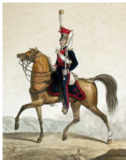
Офицер Польского уланского полка