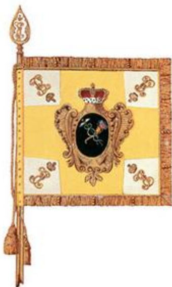
Знамя Харьковского драгунского полка