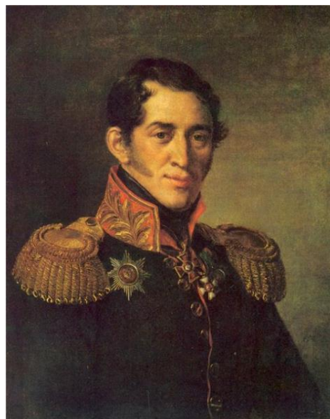
Сергей Григорьевич Волконский

Сведения, связанные с местечком Ставище, свидетельствуют про подготовительный период декабристского восстания, о посыльных, которые координировали действия тайных обществ и кружков России. Через Ставище ехал в Умань к князю Сергею Григорьевичу Волконскому штабс-капитан Фохт. Здесь он встречался с полковником Георгием Александровичем Кончияловым, членом Южного общества, командиром Харьковского драгунского полка, штаб которого находился в Ставище. Впоследствии Фохт побывал здесь еще дважды: летом и в первых числах декабря 1825. Известно также, что 8 января 1826 в Ставище полковник Кончиялов был арестован генералом Крейцем. 12