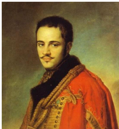
Николай Николаевич Раевский

Во времена реформирования армии правительством Николая I, в начале 1830 годов в Ставище размещался Польский уланский полк.