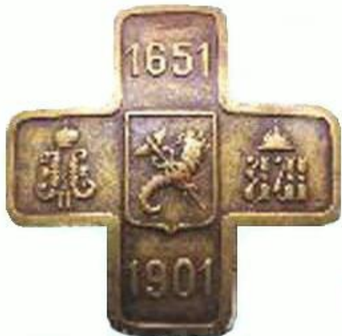
Харьковский драгунский полк